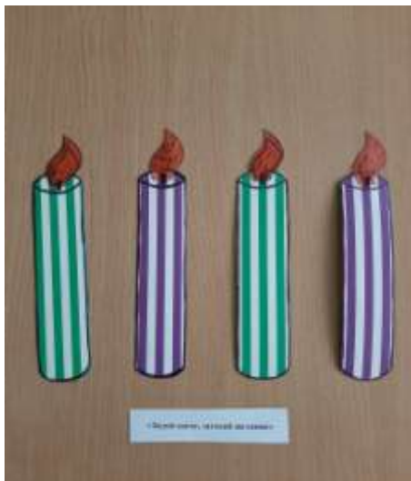
Игровое упражнение «Задуй свечу, загадай желание»