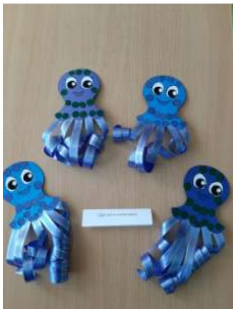
Игровое упражнение «Весёлые медузы»