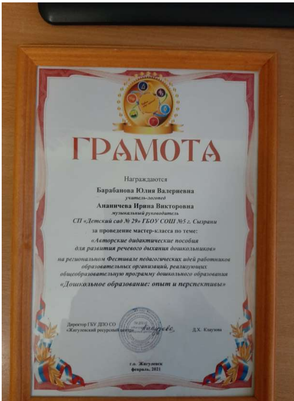
Все фотоматериалы представлены с письменного разрешения родителей (законных представителей). Спасибо за внимание!