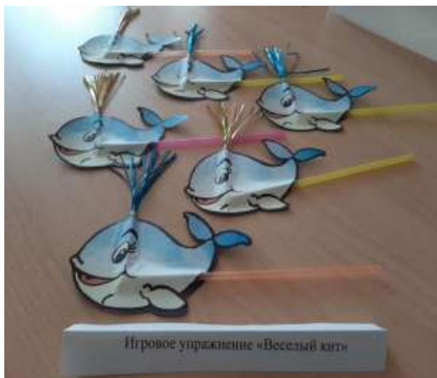
Игровое упражнение «Веселый кит»