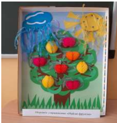
Игровое упражнение «Найди фрукты»