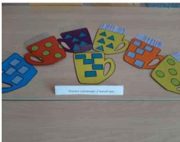
Игровое упражнение «Горячий чай»