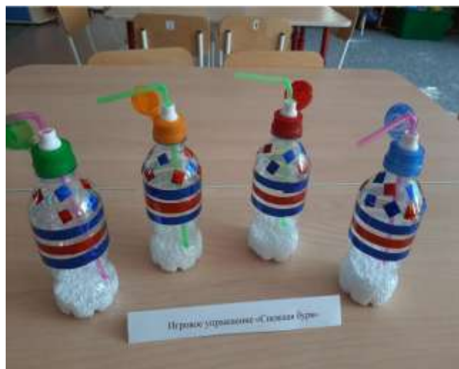
Игровое упражнение «Снежная буря»