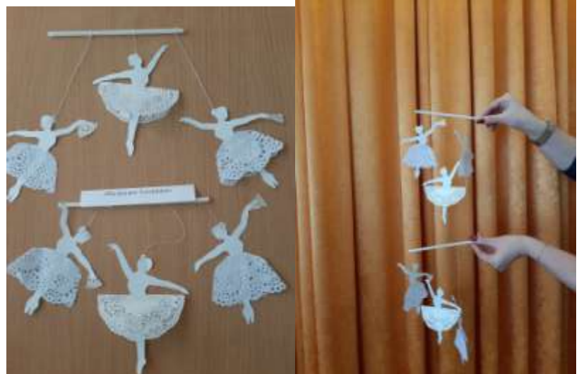
Игровое упражнение «Маленькие балеринки»