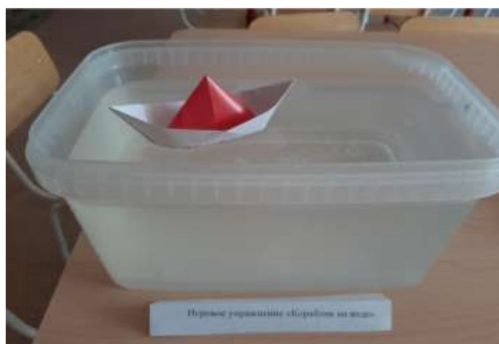
Игровое упражнение «Корабик на воде»