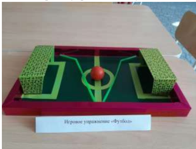
Игровое упражнение «Футбол»