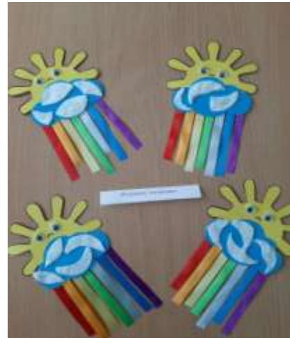
Игровое упражнение «Радужные солнышки»